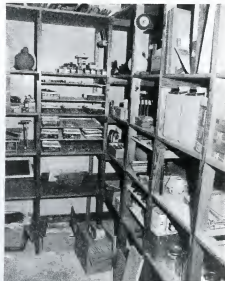
In tegenstelling tot het handenarbeidmagazijn.